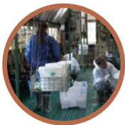
Hygiene und Resilienz